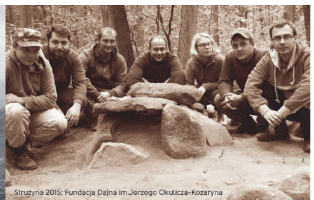
Struzyna 2015; Fundacja Dajna im. Jerzego Okulicza-Kozaryna