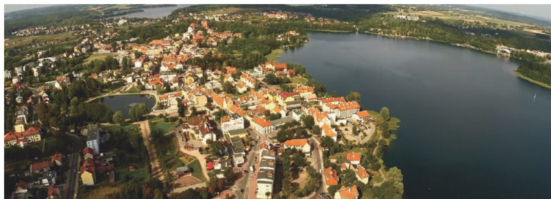
Mrągowo znalazło się w rankingu miast powiatowych i zajęło wysokie 28 miejsce na 267 samorządów.

Przed nami ostatni okres finansowania z Unii Europejskiej na lata 2014-2020.